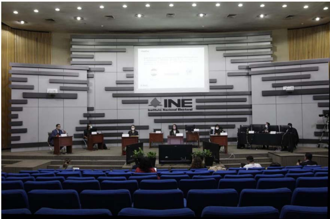
Imagen 1. Espacios que se utilizarán este 10 de abril de 2022 para el escrutinio y cómputo.

De acuerdo con el numeral 37 de los LOVEIRM, el Local Único para la instalación, integración y funcionamiento de la MEC Electrónica en la que se realizará el cómputo y resultados de los votos emitidos por las y los mexicanos residentes en el extranjero para el PRM, serán las Oficinas Centrales del INE con domicilio en Viaducto Tlalpan 100 Edificio B, Colonia Arenal Tepepan, Alcaldía de Tlalpan, C.P. 14610 Ciudad de México, específicamente en el Auditorio del Edificio B.