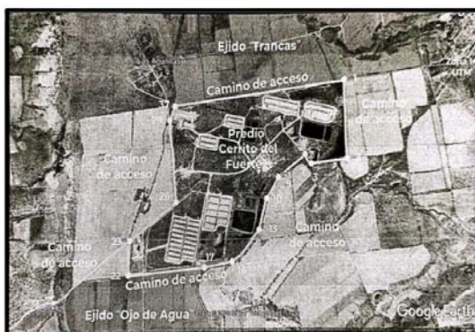
UBICACIÓN DEL PREDIO "CERRITO DEL FUERTE" Y SUS COLINDANTES.